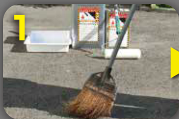
1 塗装面の汚れ・ゴミ・水分等を取り除いて下さい