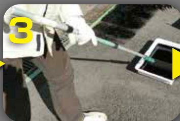
3 油性用のペイントローラーで塗装して下さい